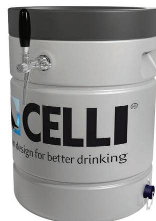
Distributeur de Bière

N'hésitez pas à nous demander comment nous pouvons aider votre organisation à implémenter ces nouveaux systèmes de distribution durables, efficaces et de basse consommation.